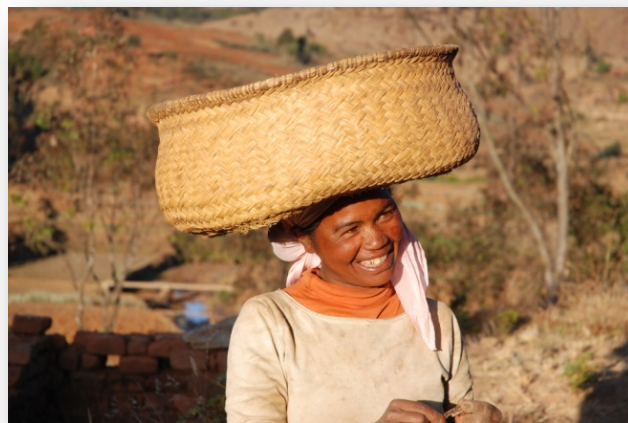
Le légendaire sourire de la population malagasy !

Nombre de places limité ! Inscrivez-vous vite !