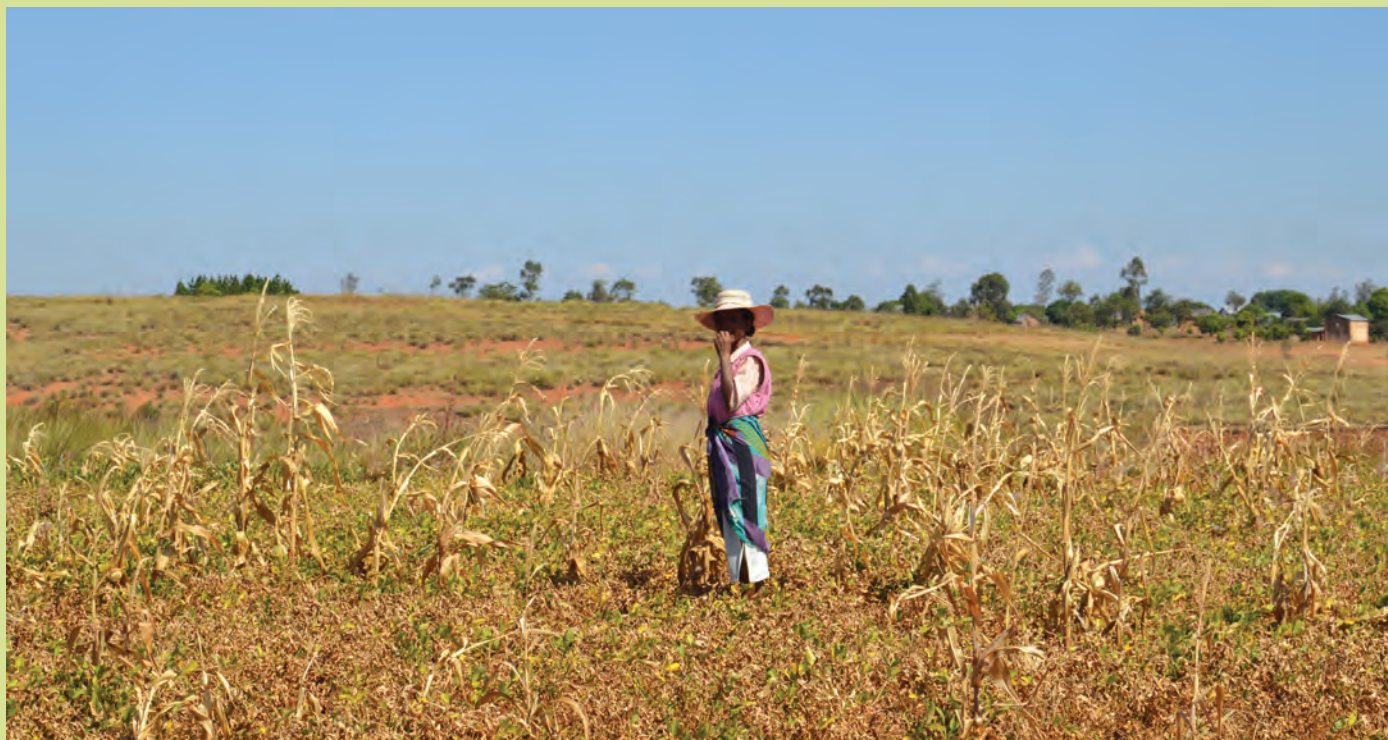
Les productrices et producteurs partenaires du CEAS améliorent leur condition grâce à des pratiques respectueuses de l'environnement.

Dans sa nouvelle phase, le programme de valorisation des produits agricoles du CEAS soutient des petites entreprises qui cherchent à améliorer la qualité de leur