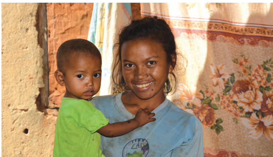
La production de farines infantiles permet aux jeunes mères d'offrir une alimentation équilibrée à leurs enfants.