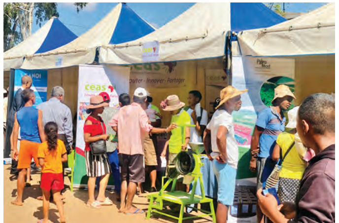
Présentation des machines destinées à la transformation des aliments lors de la Foire régionale de Bongolava.

chant la gestion et l'autonomie financière est aussi venu s'ajouter au programme. Les principales bénéficiaires du projet Far'In sont les femmes et les jeunes mères de 26 villages dans la région Bongolava. Ces mères désirent par-dessus tout lutter contre la malnutrition qui sévit dans leur région. Le projet Far'In leur propose ainsi de les informer sur les enjeux nutritionnels des enfants, de leur apprendre les bonnes pratiques en gestion des cultures et de