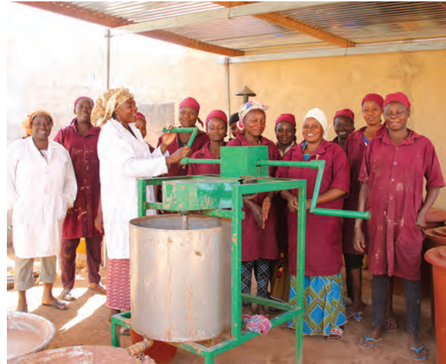
La fabrication des savons permet aux femmes de subvenir à leurs besoins et d'envoyer leurs enfants à l'école.

Malgré l'insécurité et l'isolement lié aux crises politiques et au climat du pays, les femmes de la savonnerie n'ont jamais baissé les bras. Elles ont surmonté les nombreux défis pour continuer, encore aujourd'hui, de produire des savons de qualité disponibles dans le shop équitable et qui leur permettent d'obtenir un salaire supplémentaire pour subvenir aux besoins de leur famille.