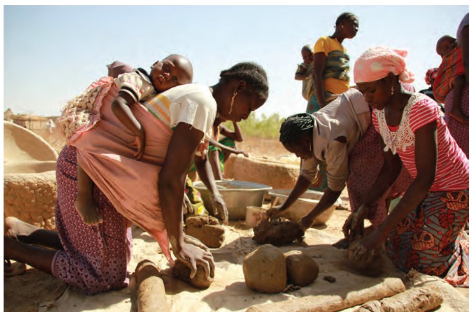
Mères de familles, travailleuses, responsables des tâches ménagères, les femmes cumulent souvent beaucoup de responsabilités.